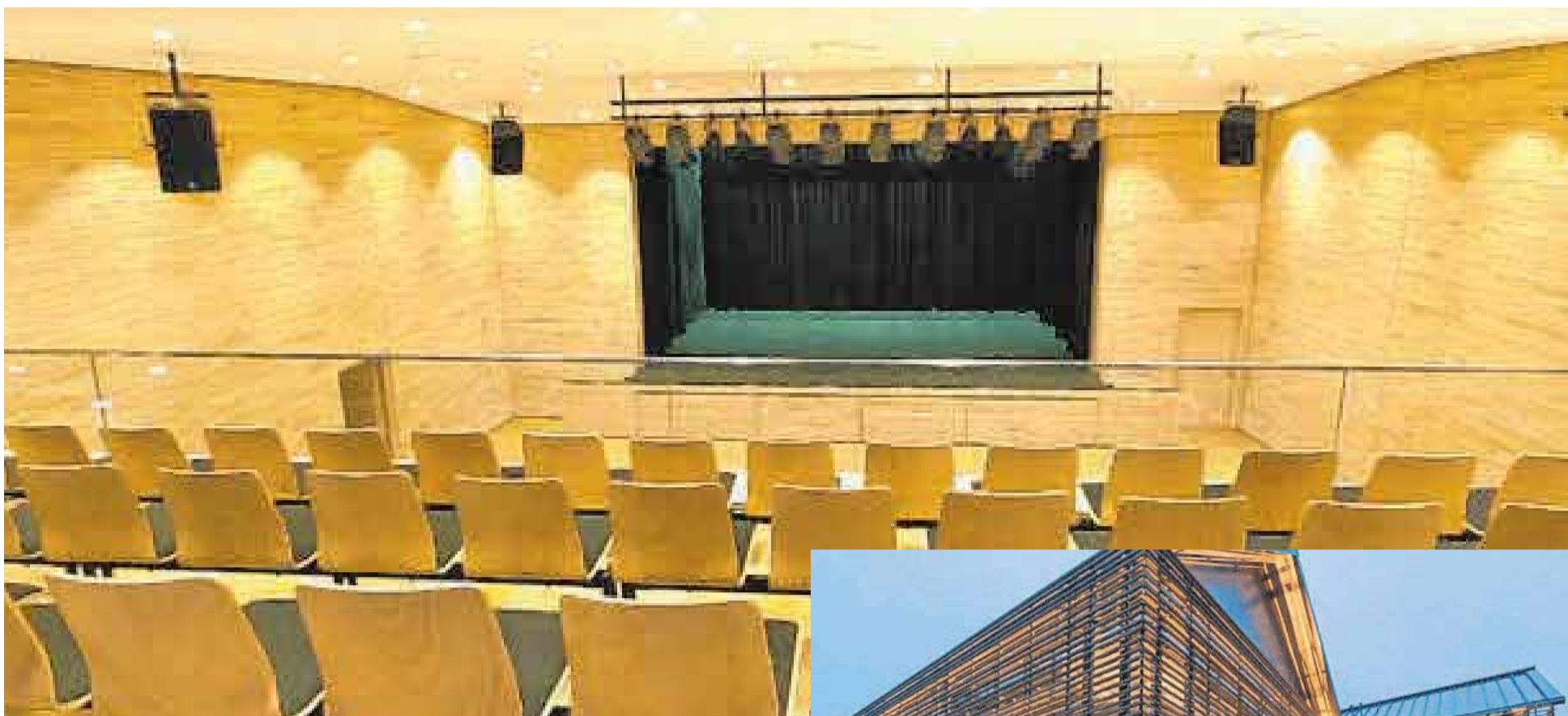
Der Welterbe-Saal für rund 300 Besucher ist neben der Tourist-Info das Herzstück des Neubaus in Uhldingen-Mühlhofen.

Rund drei Millionen Euro wurden für den schmackhaften Neubau investiert – knapp 600 000 Euro wurden über Zuschüsse aus dem Ausgleichsstock und der Tourismusförderung getragen, den rest finanziert die Gemeinde. Bürgermeister Edgar Lamm sprach beim symbolischen ersten Spatenstich von einem „neuen Kapitel für den Tourismus“, das in der Gemeinde aufgeschlagen werde – und das ist es tatsächlich. Viele verschiedene Möglichkeiten, wo man künftig die Tourist-Information unterbringen könnte, waren diskutiert worden – schließlich hatte sich der Gemeinderat aber für den Neubau entschieden und lag damit goldrichtig. Besucher der Gemeinde begreifen nun bereits beim Besuch der Tourist-Info, dass sie in einer besonderen Gemeinde ange-